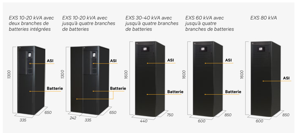
Architecture Liebert EXS