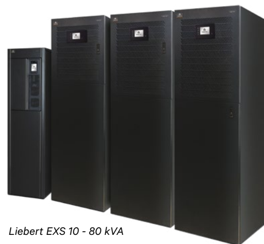
Liebert EXS 10 - 80 kVA