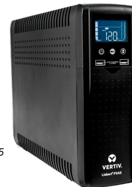
UPS Vertiv™ Liebert® PSA5