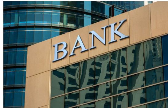
Bancos e Instituições Financeiras