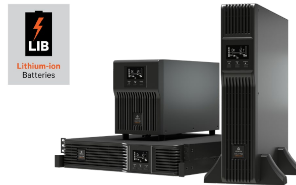
UPS Liebert® PSI5 com bateria de íon-lítio