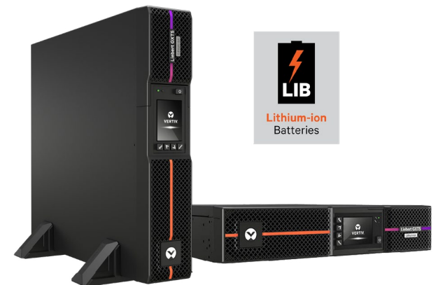
UPS Vertiv™ Liebert® GXT5