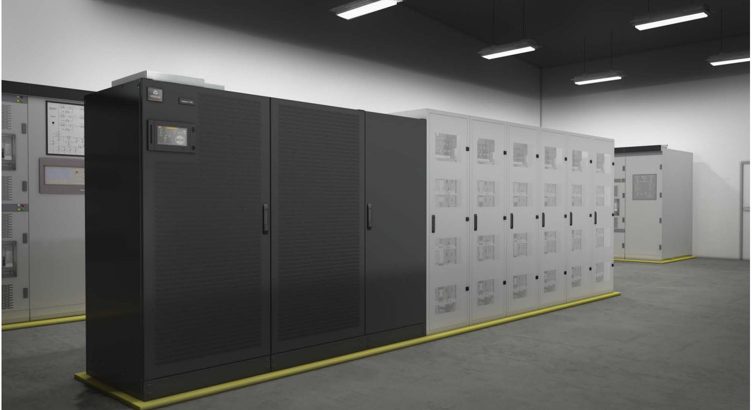
Gabinetes de baterias de íon-lítio próximas a um UPS 1200kW

As páginas a seguir endereçam questões usuais sobre o uso de baterias de íon-lítio no espaço crítico.